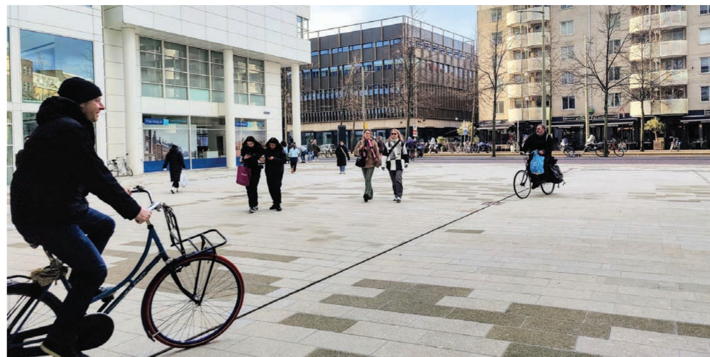
Het plein bij de achteringang van het stadhuis met de nieuwe beige tegels en soms donkere exemplaren