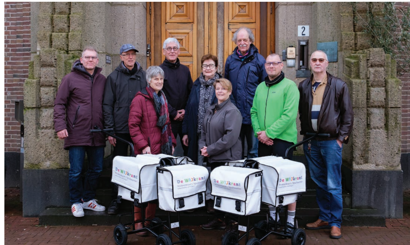
Voor de bezorging van de wijkkrant zijn deze postkarren aangeschaft. Dat was nodig want de kranten worden dikker en de oplage groter. We zijn er blij mee. Op de foto een deel van het team bezorgers.