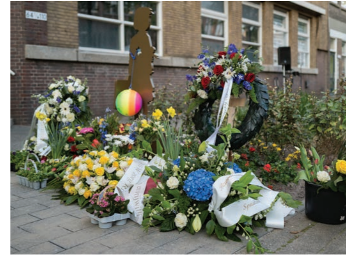
herdenking Pletterstraat 2023

Kom op zaterdag 4 mei 2024 naar het voormalige Joodse Weeshuis in de Pletterijstraat ter hoogte van nummer 66 bij het beeldje. Daar herdenken we jaarlijks de slachtoffers uit de Tweede Wereldoorlog.