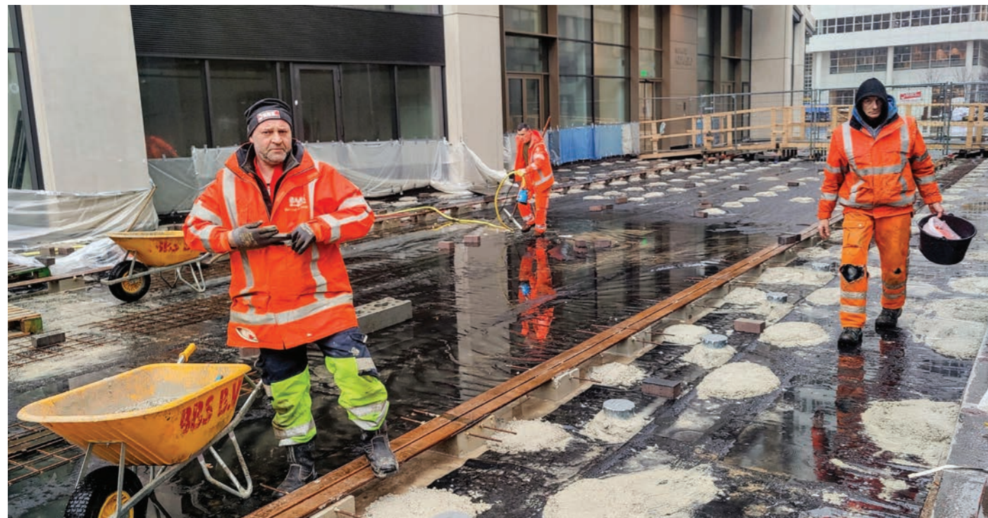
Stratwerkers aan het werk op de Turfhaven

Na jaren van bouwactiviteiten krijgt de openbare ruimte in het Spuikwartier langzaam maar zeker zijn uiteindelijke vorm. Op verschillende plekken tegelijk werken aannemers aan de definitieve inrichting van de straten en pleinen rond het stadhuis en Amare. Halverwege 2024 moet een groot deel klaar zijn. Toch is het Spuikwartier dan nog niet helemaal af.