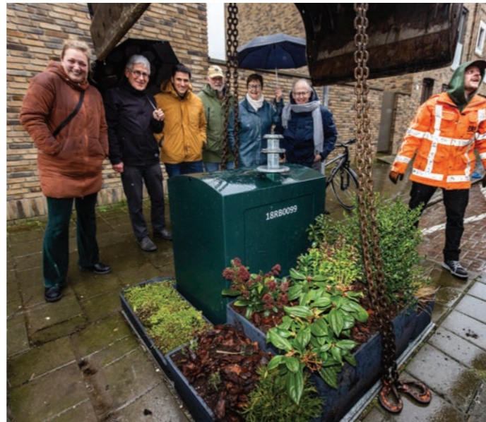
In de stromende regen werden de containertuintjes in de Amstelstraat geplaatst. Bewoners zijn blij met de komst van de tuintjes.

De gemeente Den Haag heeft de afgelopen weken vijftig containertuintjes geplaatst in de stad. Ook de Amstelstraat is opgevulld met drie van die tuintjes. Ze worden verzorgd door enkele bewoners die eromheen wonen. Het fleurt de straat enorm op en hopelijk vinden de boosdoeners het zonde om vuilnis naast de mooie plantenbakken te zetten.