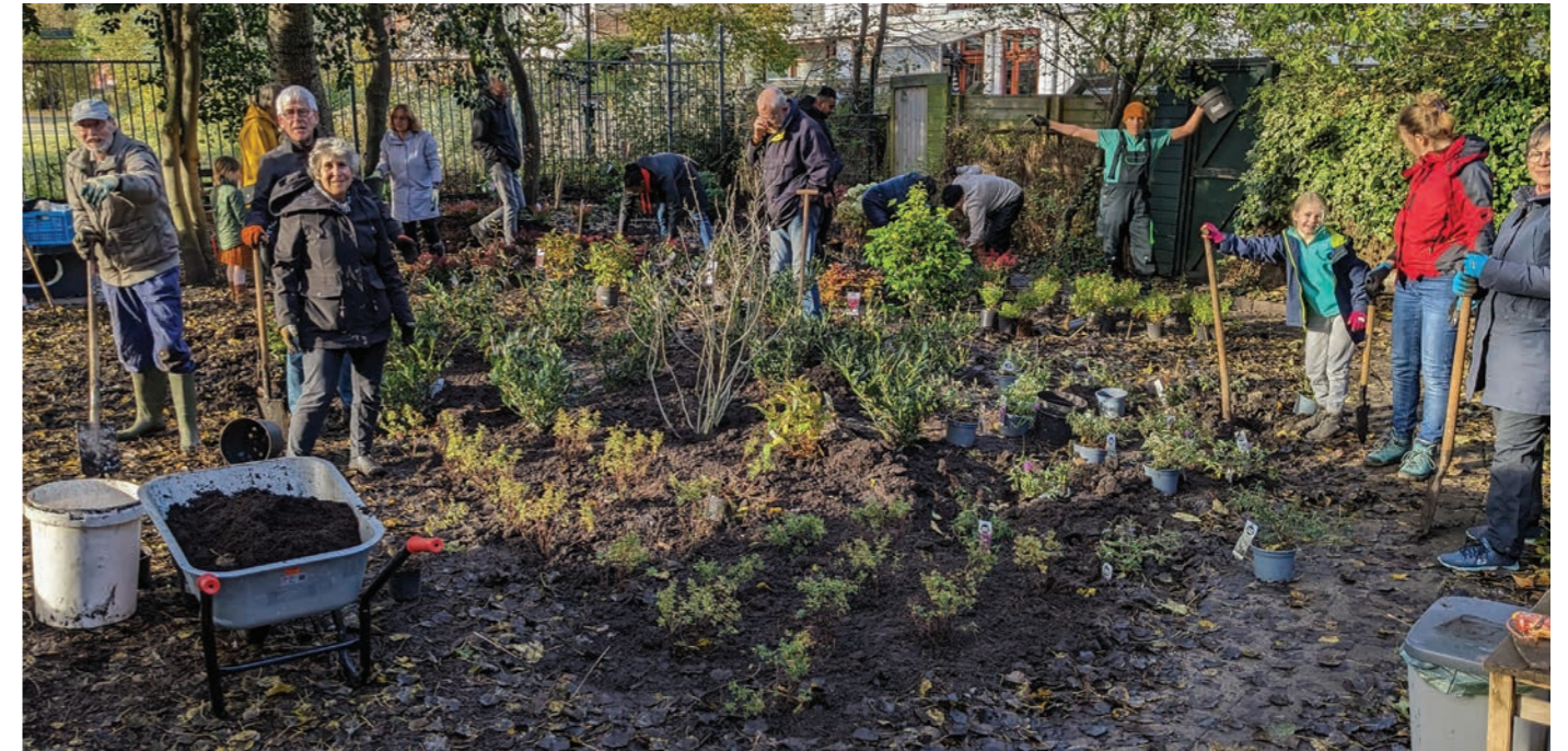
Enthousiaste bewoners werken in de wijkteuin.

Vanaf 1 maart is Wijkteuin Rivierenbuurt drie dagen per week open voor alle wijkbewoners. Op woensdag en zaterdag van 9 tot 19 uur en op zondag van 9 tot 17 uur. Je kan er heerlijk zitten en genieten van de natuur. Er is een picknickbank en kinderen en volwassenen kunnen vlakbij de tuin voetballen of basketballen. Je vindt de wijkteuin langs de spoorlijn, bij de Eemstraat.