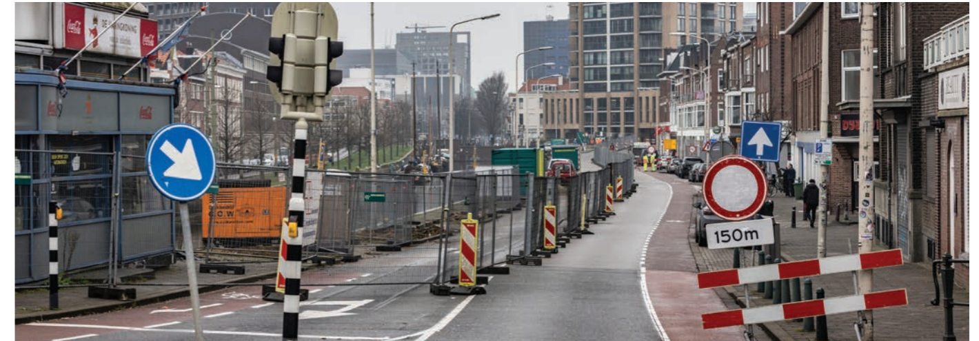
De Pletterijkade

Het werkterrein is ingericht en halverwege maart begint aannemer Dura Vermeer aan het vervangen van het eerste deel van de kademuur. In het voorjaar wordt ook het riool in de Gouwestraat, Mijdrechtstraat en Vechtstraat vervangen. Natuurlijk niet in alle straten tegelijk. Dit werk gebeurt in 4 delen en bewoners en ondernemers worden hier apart over geïnformeerd.