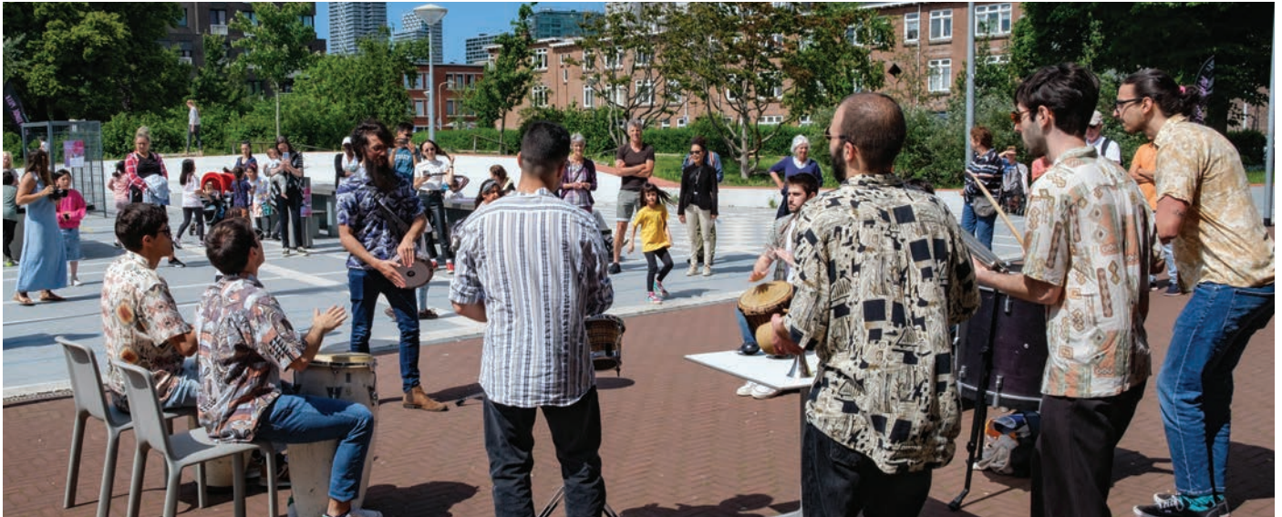
Optreden van La Maquina bij O3

Wat is er tussen nu en 1 juli allemaal te doen in onze wijk?