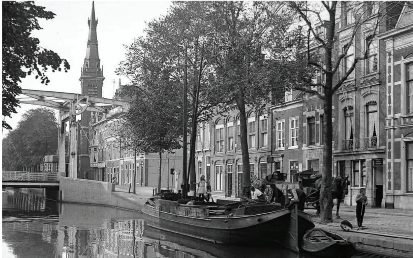
1930. Zwarteweg links. Oranje Buitensingel rechts (ten tijde van de foto Zuidoost Buitensingel) richting Herengracht. Toen nog met de ophaalbrug. Op de achtergrond de Oosterkerk, later Hot Theater.