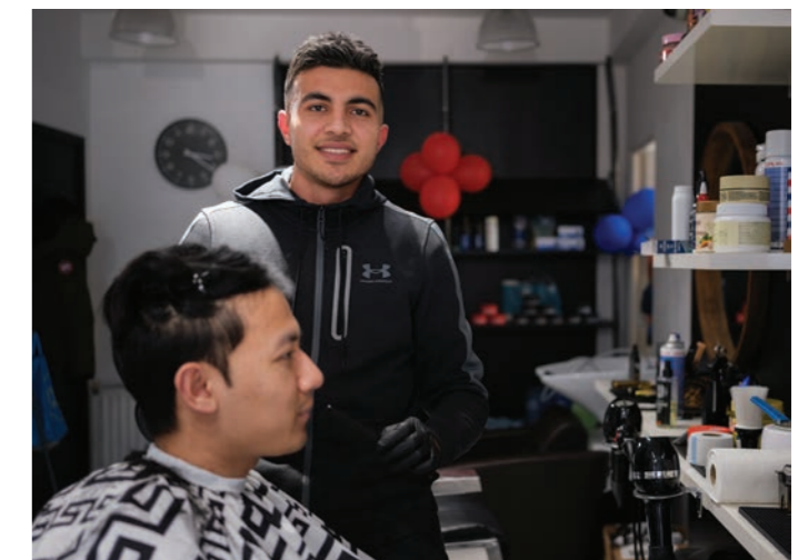
De zoon van Enayat in zijn pas geopende kapsalon naast de kleermakerij.