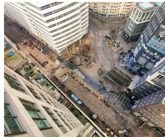
De Turfmarkt en Wijnhaven van bovenaf; de inrichting moet nog voor de zomer 2024 klaar zijn

Het Stadsbalkon moet uiteindelijk doorlopen tot achter een nog te bouwen woontoren op de plek van het Lucent Danstheater. Hoe die eruit gaat zien en wanneer hij