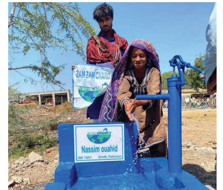
Waterput in Tsjaad waarvoor Nassim's vrienden geld ophaalden.