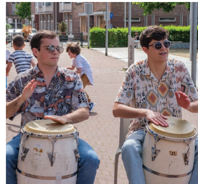
Muzikanten van La Maquina, een gezelschap van het Koninklijk Conservatorium, tijdens een optreden bij O3 op 10 juni 2022.

Het Platform Kunst en Cultuur heeft de afgelopen 2 jaar een kunstroute, een dansmiddag, een sociaal historische wandeling en een fototentoonstelling georganiseerd. We willen eind september een muziekevenement organiseren. We hebben in de wijk podia in het wijkgebouw O3, de Kunsthut en natuurlijk Amare. Bij de wijktuin is een mooi openlucht "podium". Graag komen we in contact met studenten van het Koninklijk Conservatorium en andere musici om in de wijk een mooi event te organiseren. De ervaring leert dat er voor een goed plan altijd geld beschikbaar is. Dus doe mee en meld je aan via info@brs-den Haag.nl of het telefoonnummer van de Bewonersorganisatie Rivierenbuurt-Spuikwartier 070 8200187