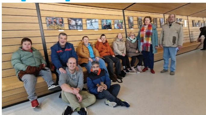
Fenix Theatremakers bezoeken de tentoonstelling Wij Rivierenbuurt in Amare.